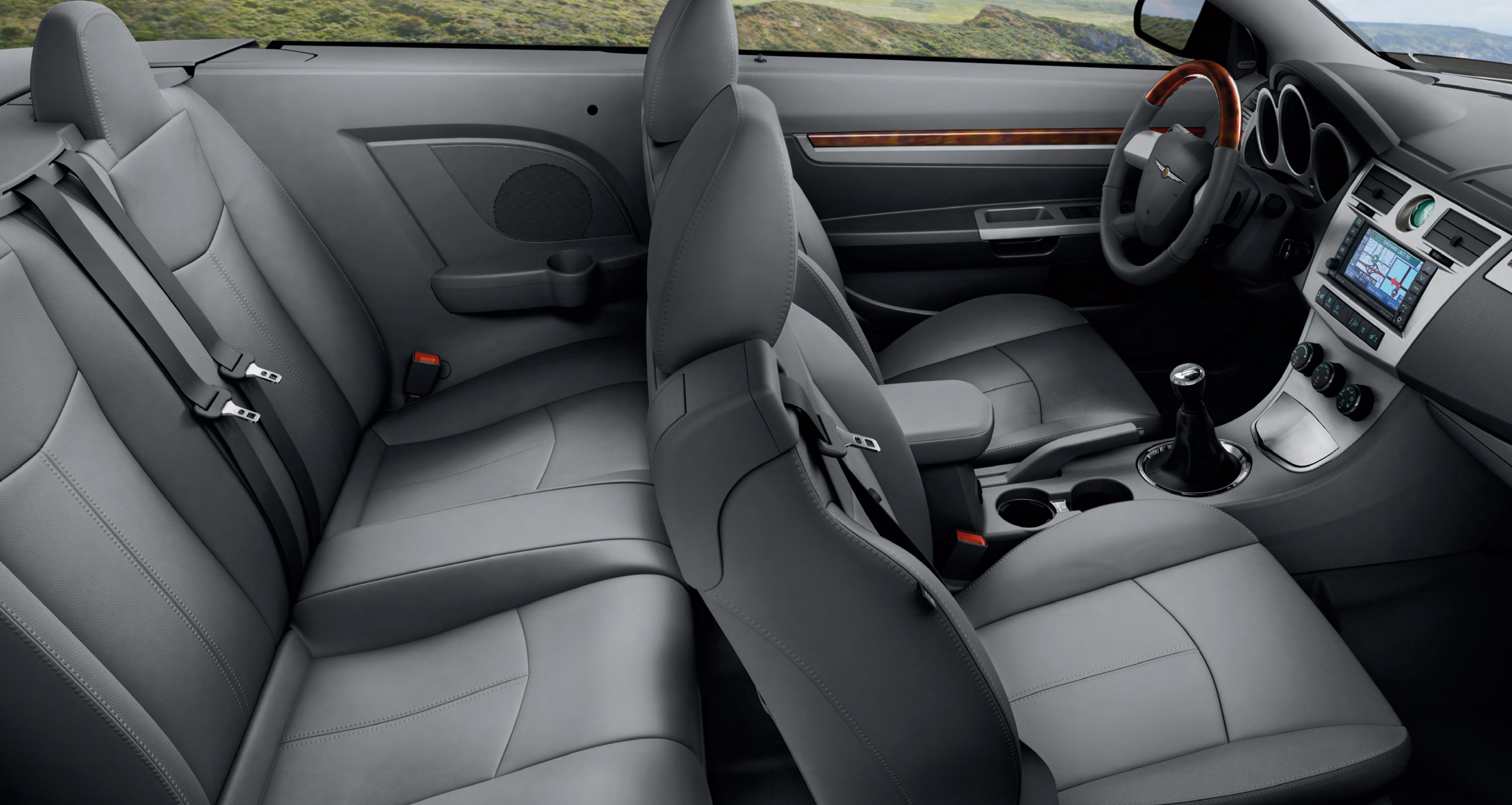
Interior del Sebring Cabrio Limited con tapicería de Cuero Bitono Gris Pizarra / Gris Pizarra Claro

El Sebring Cabrio Limited sabe cuidar a sus cuatro ocupantes. De serie, la tapicería de cuero bitono armoniza con las molduras en símil Carey y las amplias superficies cromadas. Los asientos integran los cinturones de seguridad y elementos calefactores que contrarrestan el frío de las noches de otoño. Además, el del conductor es regulable eléctricamente en seis direcciones. En cada detalle, el interior del Sebring ofrece alta calidad que se ve y se siente.