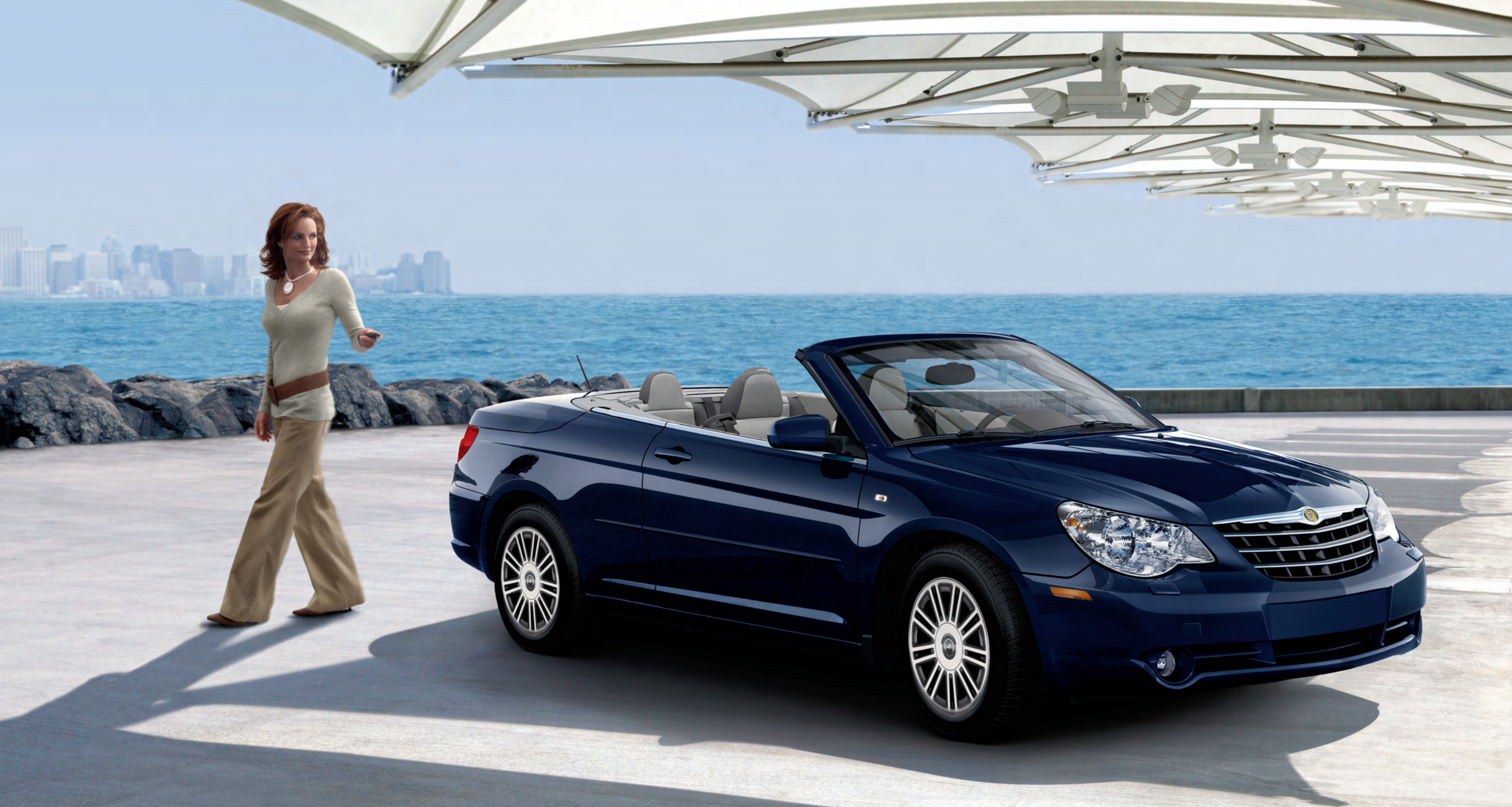
Sebring Cabrio en color Azul Moderno Metalizado

El Sebring Cabrio atrae las miradas con la misma naturalidad con la que atrae el sol. Los faros halógenos cuádruples y la imponente parrilla transmiten confianza. Los faros antiniebla contribuyen de forma brillante al dinámico diseño frontal. Desde cualquier ángulo, el Sebring