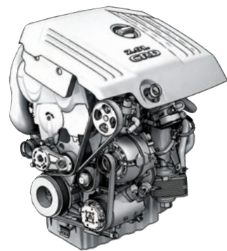
2.0 CRD (140 CV)