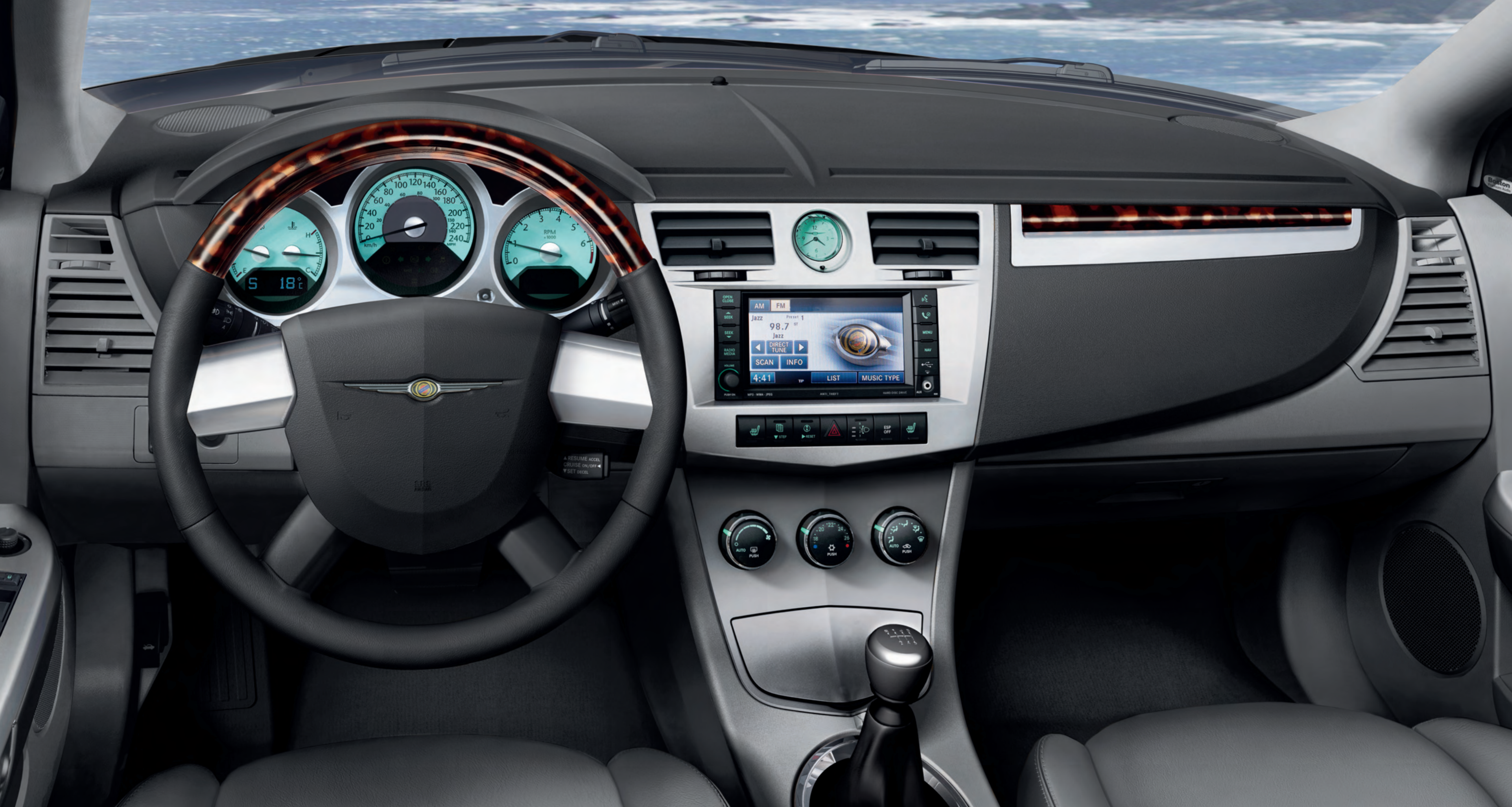
Interior del Sebring Cabrio Limited con tapicería de Cuero Bitono Gris Pizarra

Bienvenido a un puesto de conducción que conquista por su original diseño y sofisticación tecnológica. El salpicadero con estilizada forma de ala muestra un elegante acabado bitono y encierra una auténtica maravilla multimedia: el opcional sistema MyGIG®. Los mandos del