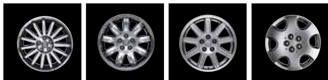
A Llantas de Aluminio Lacado de 17" B Llantas de Aluminio Cromado de 16" C Llantas de Aluminio Lacado de 16" D Llantas de Acero de 15" con Embellecedor Plateado