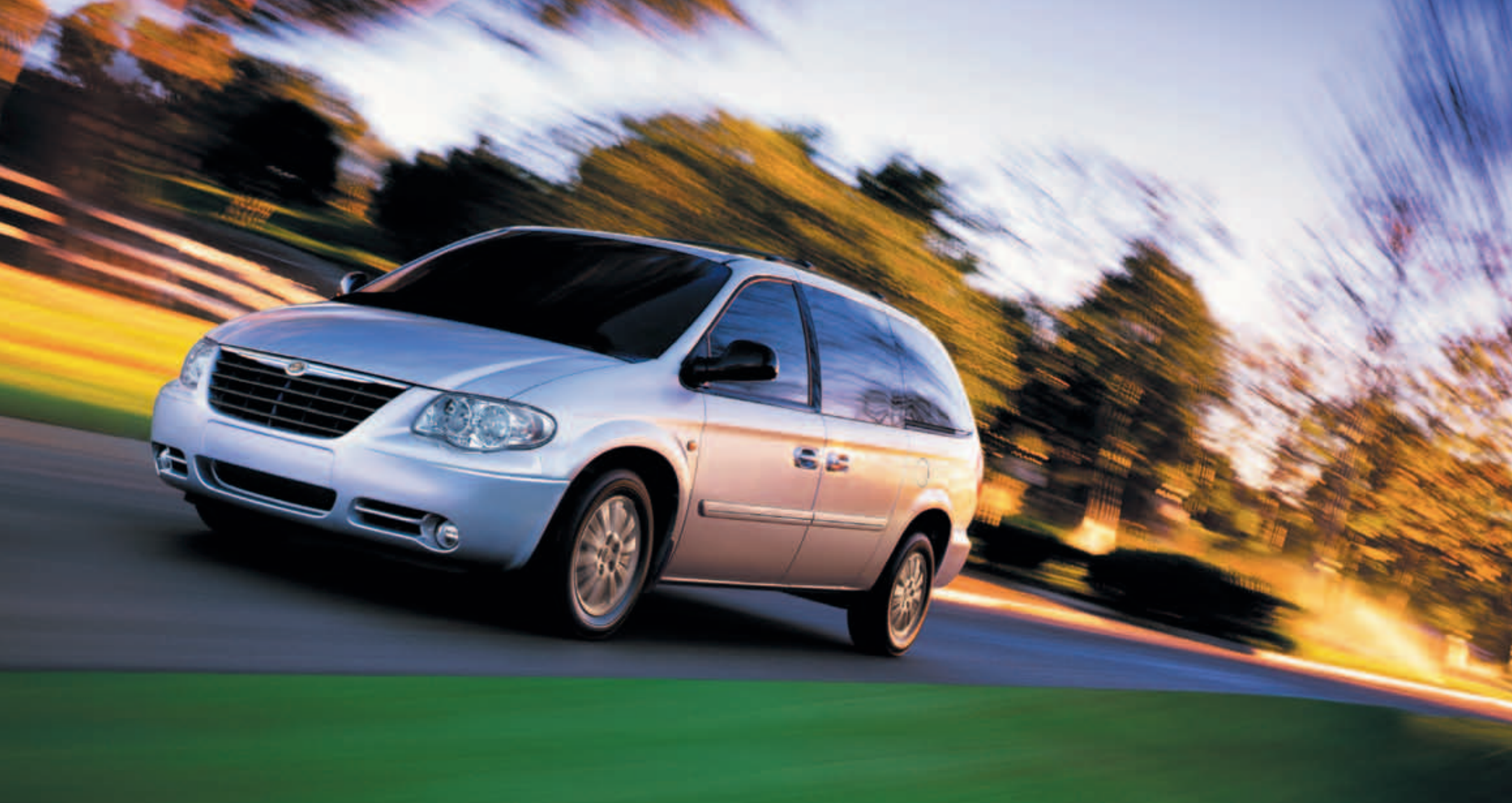
Grand Voyager LX en color Gris Plata Metalizado

Tanto el Voyager LX como el Grand Voyager LX incorporan el motor 2.8 CRD de 150 CV y 360 N•m de par motor. Además de su excelente economía, este silencioso y fiable turbodiesel se combina de serie con el cambio automático, que facilita la conducción urbana. El eficaz 2.5 CRD de 143 CV con cambio manual de 5 velocidades, completa las posibilidades de elección en Voyager LX.