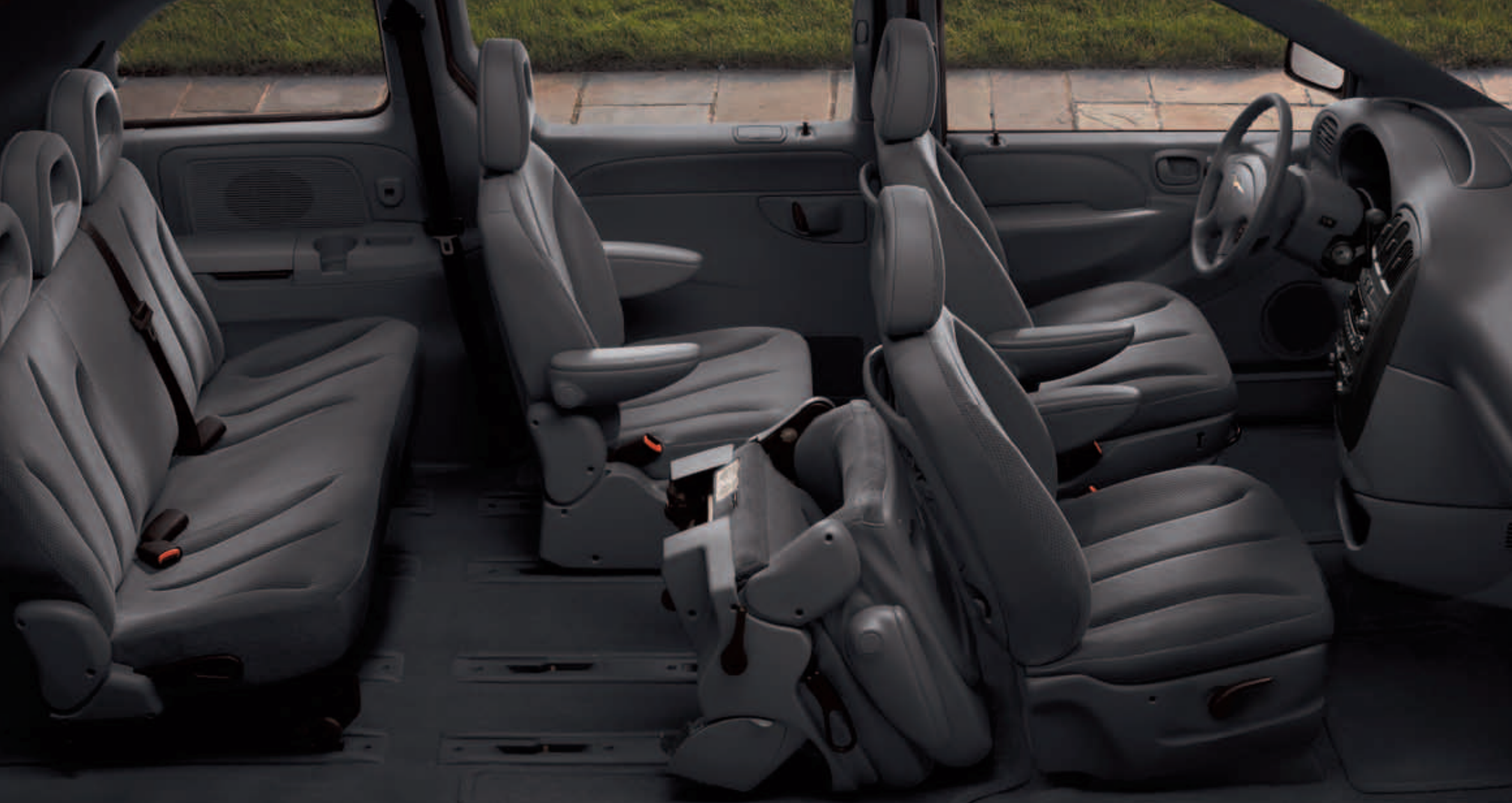
Interior del Voyager SE con tapicería textil de color Gris Cuarzo

Con atractiva tapicería en tela, el confortable interior del Voyager ofrece capacidad para 7 pasajeros. La completa instrumentación ofrece una fácil lectura. Las múltiples tomas de corriente en el interior aumentan la funcionalidad. El sistema Easy Out Roller Seats® en la segunda y tercera fila de asientos aporta una valiosa flexibilidad en términos de confort y facilidad de transporte.