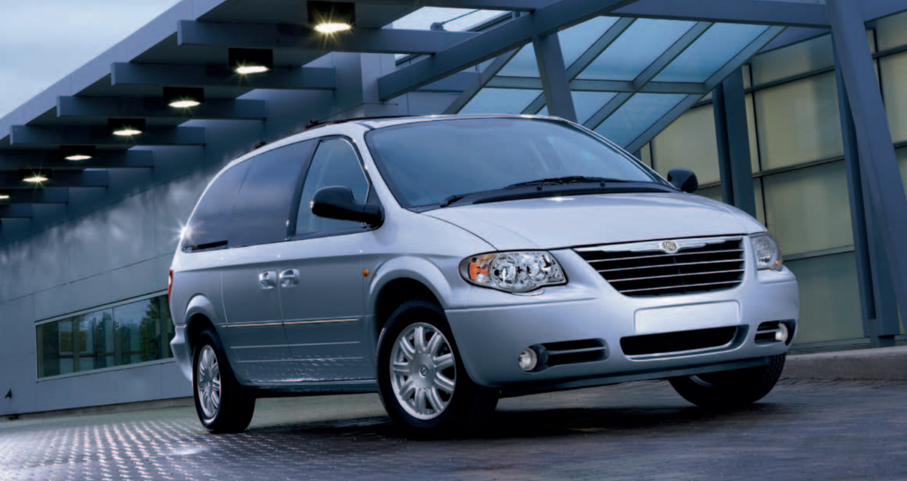
Grand Voyager Limited en color Gris Plata Metalizado

El Grand Voyager Limited está impulsado por el motor turbodiesel 2.8 CRD o por el motor de gasolina 3.3 V6, ambos con cambio automático. Desde las llantas de aluminio de 16" y los retrovisores exteriores eléctricos y térmicos, hasta las puertas laterales deslizantes y el portón trasero con accionamiento eléctrico, el Grand Voyager Limited sabe cómo añadir distinción y facilidad a la vida.