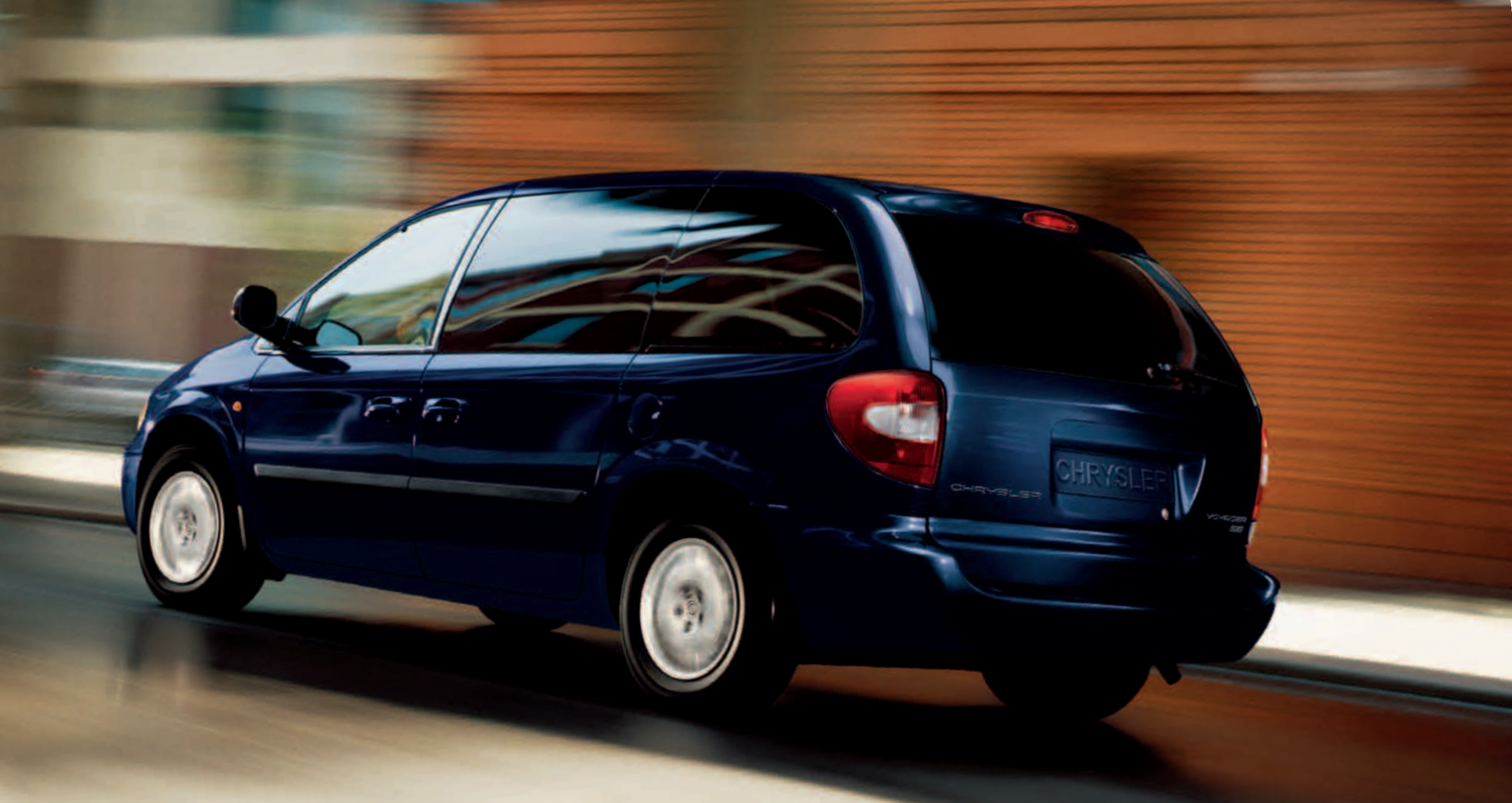
Voyager SE en color Azul Medianoche Metalizado

SE El Voyager SE une amplitud y fácil maniobrabilidad. Su gama de motores incluye los turbodiesel 2.5 CRD y 2.8 CRD y el propulsor de gasolina 2.4. El Grand Voyager SE conjuga su inmenso espacio interior con la energía del motor 2.8 CRD. La generación de motores CRD (Common Rail Diesel) aporta máxima economía, respuesta y refinamiento. El 2.8 CRD incluye de serie un cambio automático que multiplica el confort en la conducción urbana.